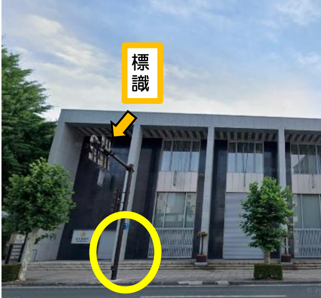
北日本銀行本店前付近

7時50分のみ停車します。 静眠堂医院はこの建物の2階部分で、1階は 「ギャラリー 夢林」となっています。その前の 路上変圧器付近でお待ちください。