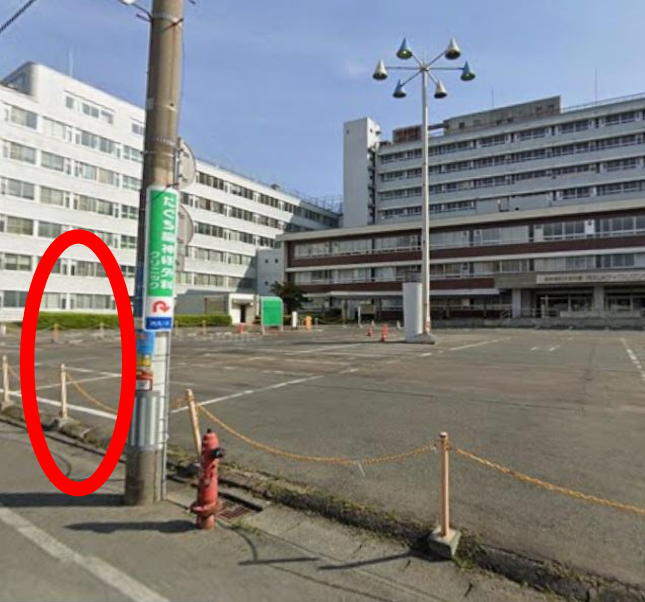
内丸メディカルセンター前付近

外来棟正面玄関前に広い駐車場があります。 駐車場前の道路にある電柱付近でお待ちく ださい。 （岩手県議会建物の裏の通りです） 渋滞等で到着が遅れることがあります。