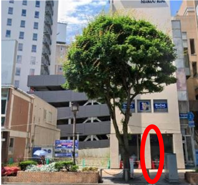
盛岡駅前（静眠堂医院前付近）

地下道の出入り口階段付近でお持ちください。 バスより先に停車している車両がある際は、 停車場所がその前後になる場合があります。