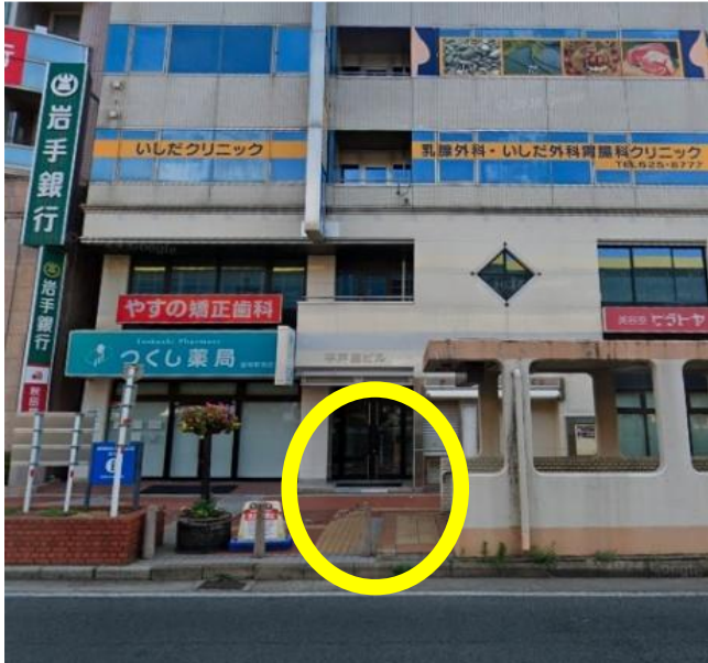
盛岡駅前（つくし薬局前付近）

地下道の出入り口階段付近でお持ちください。 バスより先に停車している車両がある際は、 停車場所がその前後になる場合があります。