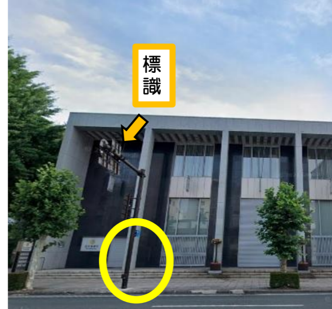
北日本銀行本店前付近

7時50分のみ停車します。 静眠堂医院はこの建物の2階部分で、1階は 「ギャラリー 夢林」となっています。その前の 路上変圧器付近でお持ちください。