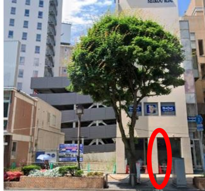
盛岡駅前（静眠堂医院前付近）

地下道の出入り口階段付近でお持ちください。 バスより先に停車している車両がある際は、 駐車場所がその前後になる場合があります。